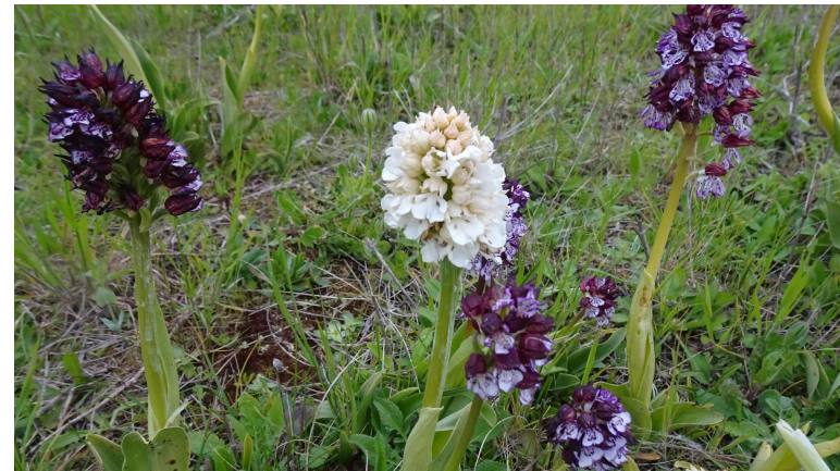
Des couleurs parfois surprenantes