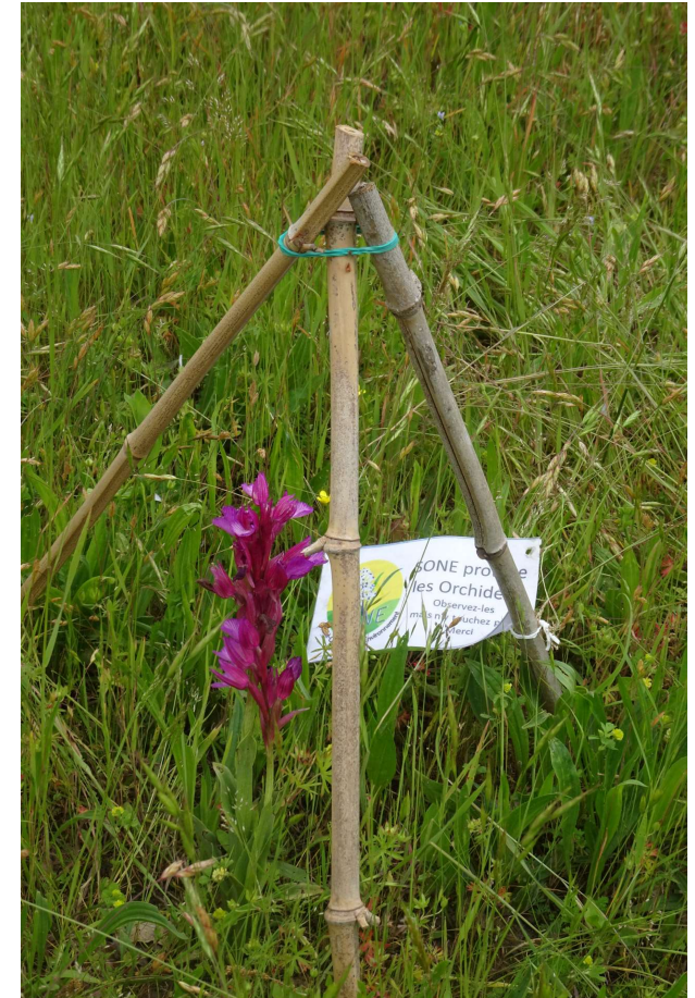
L'Orchis papillon ( Anacamptis papilionacea )

découvert cette année à Saint-Orens le 5 mai