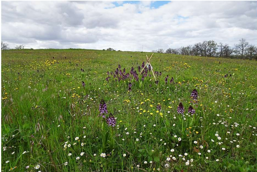
Des Orchis pourpres par centaines