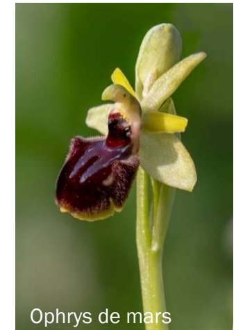
Ophrys de mars

Bord des chemins : des plantes méditerranéennes parfois présentes à Saint-Orens