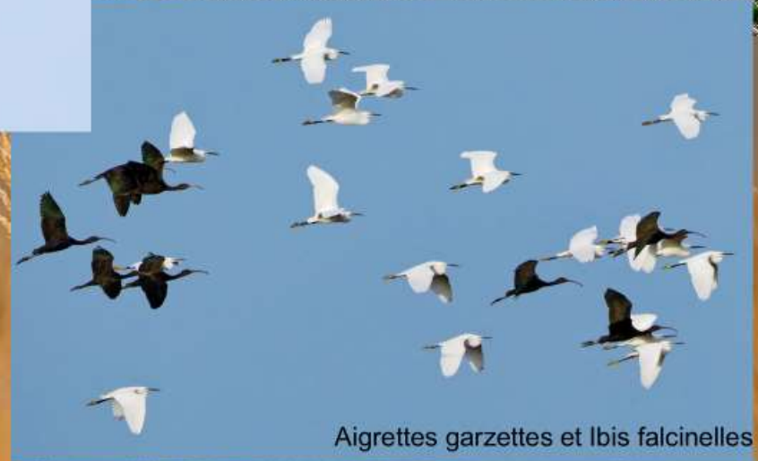
Aigrettes garzettes et Ibis falcinelles