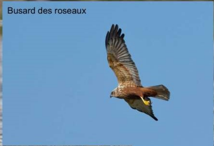
Busard des roseaux