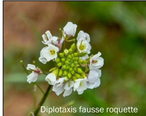
Diplotaxis fausse roquette